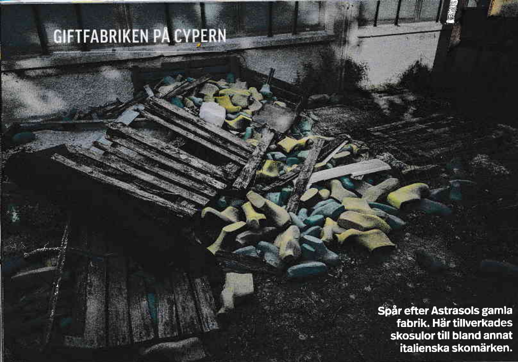
Spår efter Astrasols gamla fabrik. Här tillverkades skosulor till bland annat italienska skomärken.